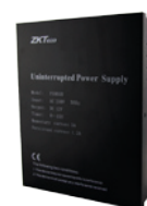
PS901B Fuente de alimentación