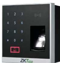
X8-BT Terminal biométrica de huella digital con bluetooth