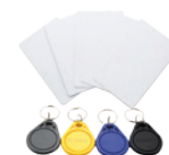
10 Tarjetas ID 10 Tag-03